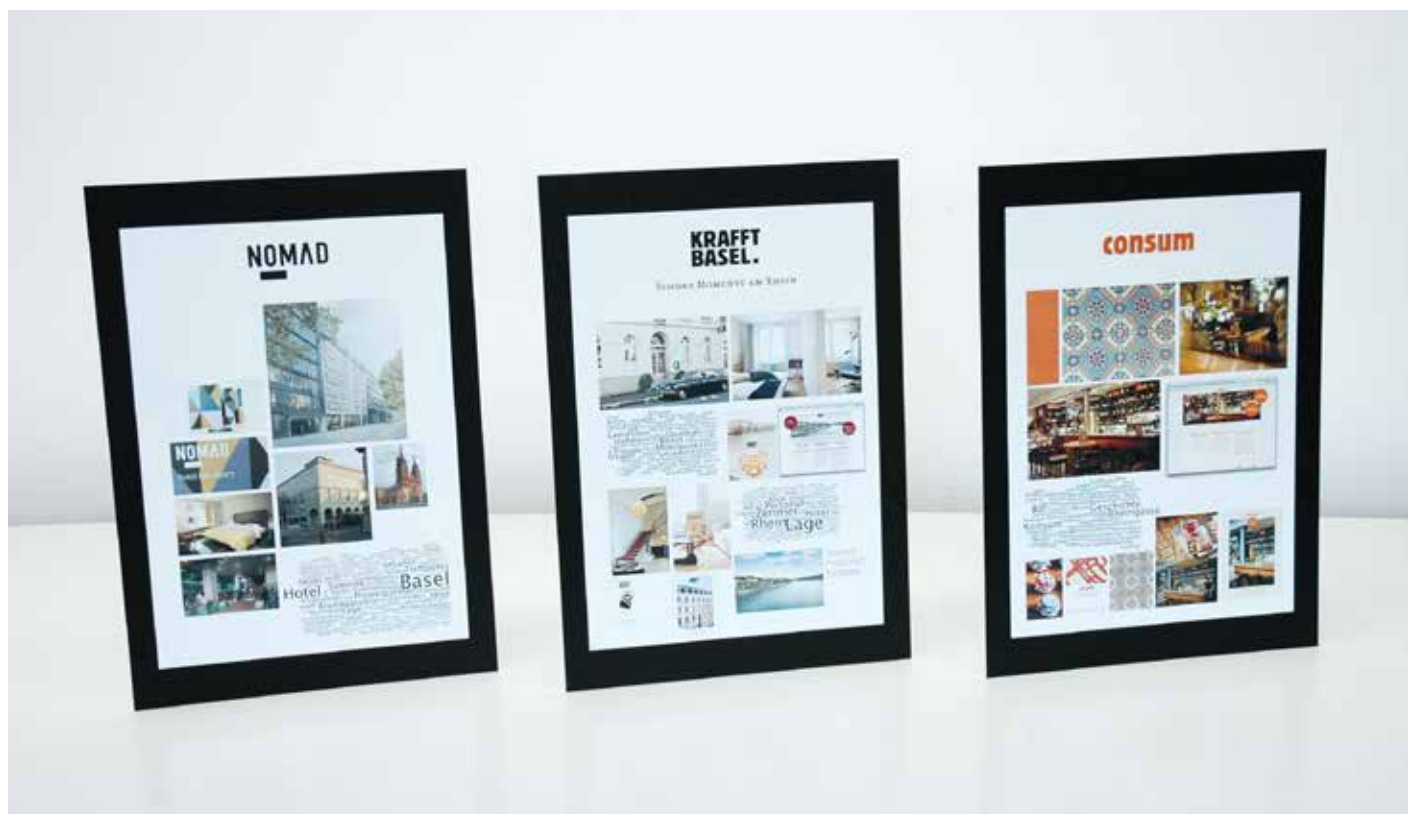
Moodboards für die einzelnen Betriebe der Krafft Gruppe

Die Krafft Gruppe versteht sich heute als Unternehmensmarke und sieht ihre Rolle darin, den Betrieben unterstützend zur Seite zu stehen und die Weiterentwicklung der Gruppe als ganzes voranzutreiben. Jeder Betrieb wird individuell positioniert und tritt nach aussen eigenständig auf. Ziele sind, das Synergiepotential der Gruppe auszuschöpfen und trotz der Heterogenität einheitliche Standards und Werte nach innen zu festigen und nach aussen zu tragen. Mit einem strategisch wertvollen Fundament an formulierten Grundsätzen ist die Krafft Gruppe für eine Zukunft mit Wachstum gut gerüstet.