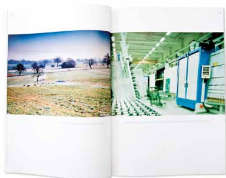
2006 Die vor allem im Bereich Maschinen und Anlagebau starke Holding thematisiert in den Bildkompositionen den dialektischen Bezug zwischen Landschaftsbildern und industriellen Produktionsstätten an verschiedenen Standorten.