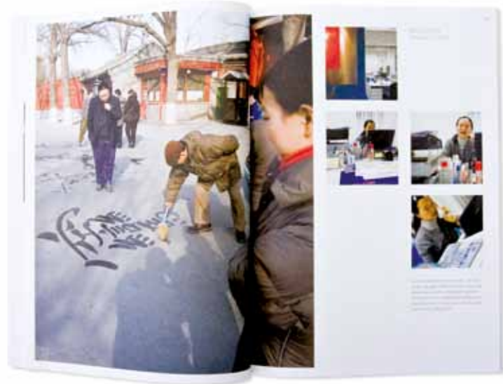
2005 Einblick in die weite Welt von Conzeta: an 50 Standorten arbeiten 3700 Mitarbeitende. In diesem Geschäftsbericht werden verschiedene Mitarbeitende aus verschiedenen Ländern in ihrem privaten Umfeld und am Arbeitsplatz porträtiert.